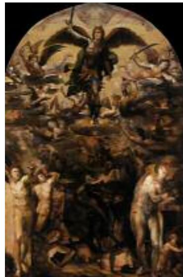
Fall of the Rebel Angels c. 1524

行動：父啊！我相信從祢手中所領受的恩寵，才是真正屬於我的財富。求祢幫助我打開心智，讓我堅信真正不朽的寶藏就在祢處，這樣我的心也必會在你處。我每天要在所有的生活小事上都守忠信，躲避一切的誘惑！求您保守！亞孟。